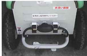
プライマリーポンプを標準装備しているの、吸水弁の固着を簡単に解除できます。