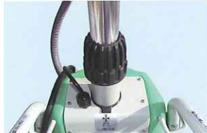
サポートイングロッド/スプリングダンパーの調整で上下高さ設定が手軽にできます。