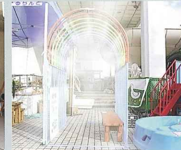
ミストアーチ 特注