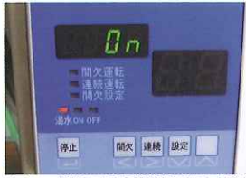
タイマー制御による自動間欠運転で、効率性のある気化を促進します。