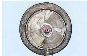
ファンカバー(安全ネット)をオプションにて取付できます。