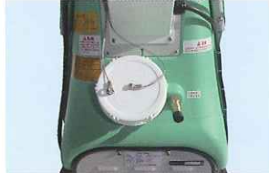
36ℓの水タンクは約2時間の連続運転が可能です。また給水する際には水道水直結も出来ます。