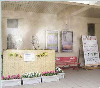
高速道路サービスエリア