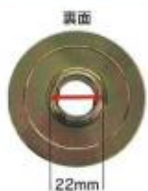
MCH-300LB カッターフランジ部