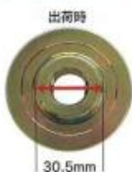
MCH-300B カッターフランジ部

カッターフランジ部を裏面(反転させる)にするとブレード軸径を22mmに替えることができます。